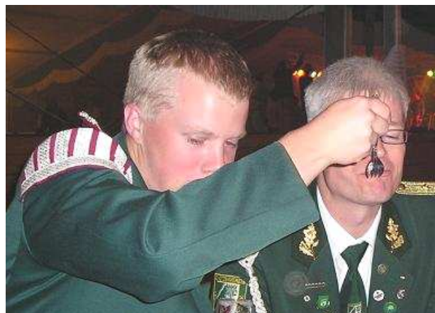
Und ganz, ganz selten geben wir auch mal was ab.