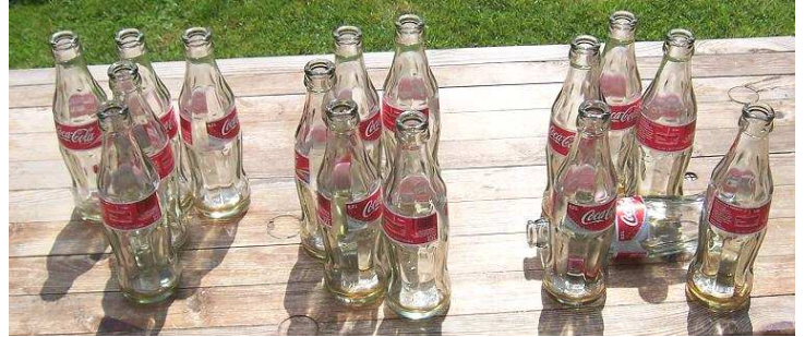
Vier aufopfernde Säufer, die so viel tranken, dass man TCA schreiben konnte.