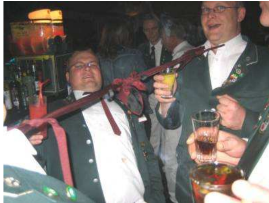
In ganz heiklen Situationen kneten sich einige unserer Musiker zusammen, damit sie sich nicht verlieren und keiner wegkommt.