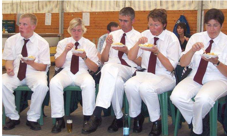
Wir sind ein ganz schön hungriger Verein...