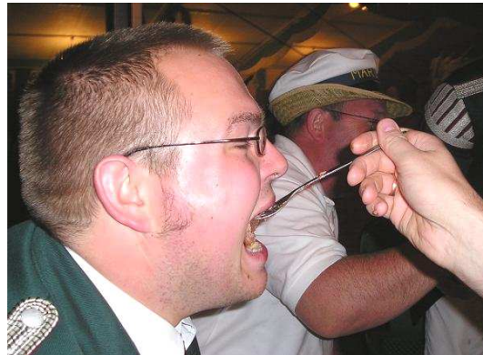
... ein Löffel für den Papa.