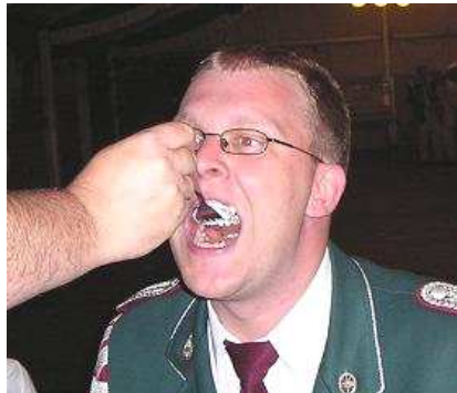
Ein Löffel für die Mama...