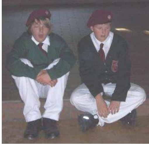
Zwei Häufchen Elend.

Das Tambourcorps Altengeseke 1993 e.V. wünscht allen Mitgliedern und ihren Familien ein Frohes Weihnachtsfest und ein gesundes Jahr 2008!